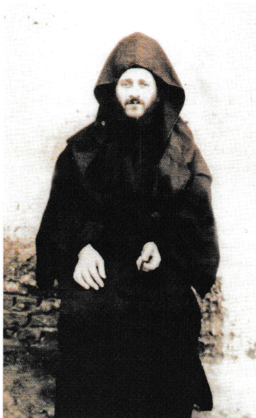
„Din toată dorirea sufletului tău să-L iubești pe Domnul!” (Gheron Iosif)

În Rugăciunea inimii, numai ce pătrunde mintea în inimă și deodată se risipește întunericul, se așterne pacea, se liniștește totul, se bucură, se îndulcește, se curățește. Omul se veselește și devine curat de patimi ca un copil mic. Mădularele trupului care-l smintesc se fac