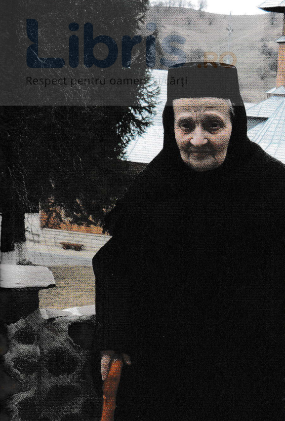
„Fără iubire nu poți să biruiești în lume” (Maica Mina)